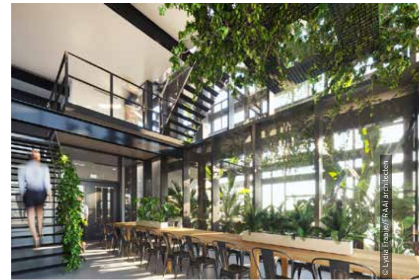
Voor dit gebouw in het Nederlandse Eindhoven diende de natuur als dubbele inspiratiebron. De vele planten en micro-organismen zorgen voor een biologische waterzuivering. De temperatuurregeling in het gebouw en de ventilatie zijn gebaseerd op de werking van termietenheuvels.