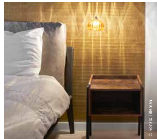
De natuur integreren in gebouwen kan ook op kleine schaal. In het interieur gaat bijvoorbeeld steeds vaker de voorkeur naar natuurlijke en duurzame materialen, zoals bamboe of behang van natuurlijk materiaal.