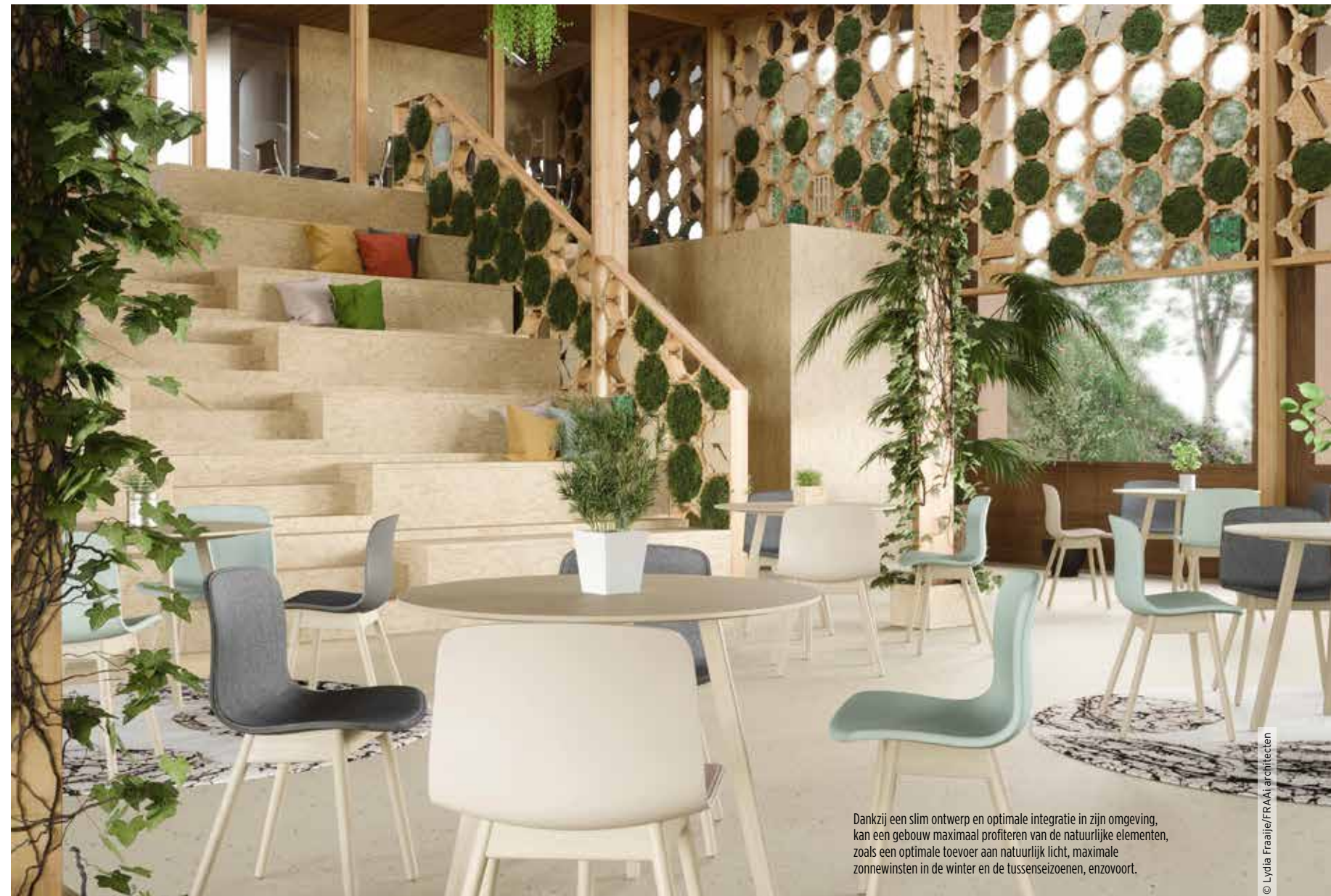
Dankzij een slim ontwerp en optimale integratie in zijn omgeving, kan een gebouw maximaal profiteren van de natuurlijke elementen, zoals een optimale toevoer aan natuurlijk licht, maximale zonnewinsten in de winter en de tussenseizoenen, enzovoort.